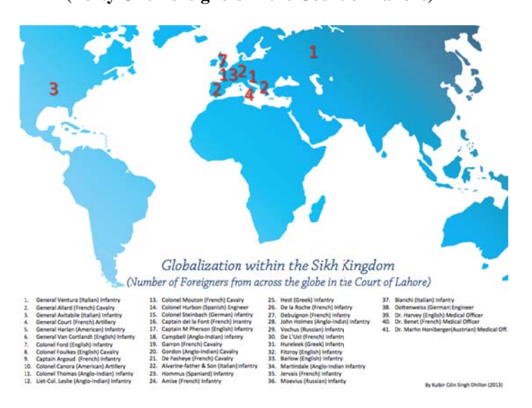
The Global attraction of Ranjeet's Sikh Empire (Forty One Foreigners in the Court of Lahore)

Many early civilizations traded with one another, this was an integral part of growth and advancement for people. When exploring the Indus valley civilization,