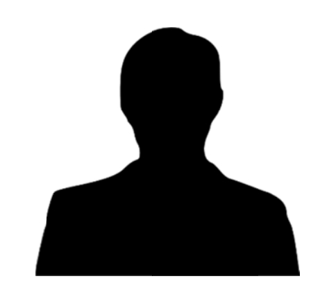
'Can't find much on him' Canora