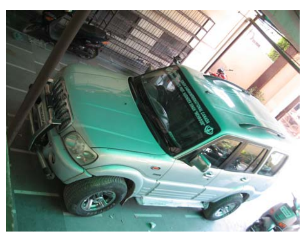
An overview of the vehicle