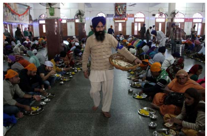
People from any community and faith can serve as volunteers.