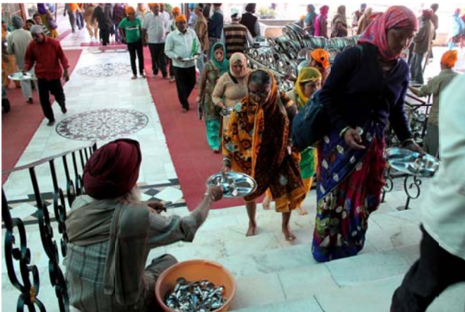
Everybody is welcome at the langar, no one is turned away. It works on the principle of equality amongst people of the world regardless of their religion, caste, colour, creed, age, gender or social status.