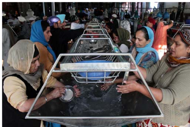
The utensils are washed in three rounds to ensure that the plates are perfectly clean to be again used.