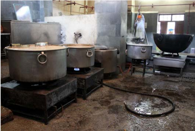
A Sikh volunteer prepares the dal (lentil soup) that will be served for the meals at the langar.