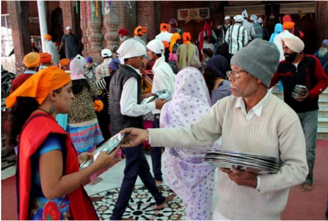
Around one hundred thousand (100,000) people visit the langar every day and the number increases on weekends and special days.