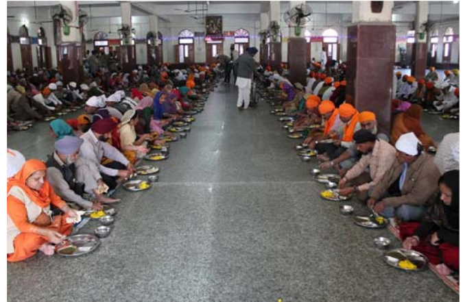
People sit on the floor together as equals and eat the same simple food at the eating hall of the Golden Temple langar.