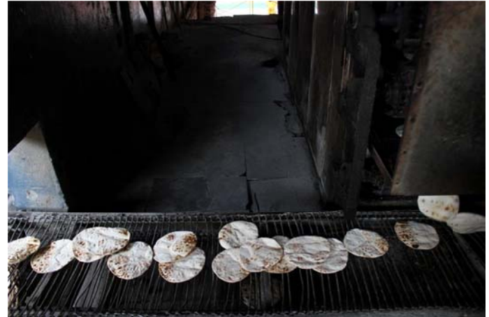
Rotis (Indian flatbread) are cooked over electric machine.