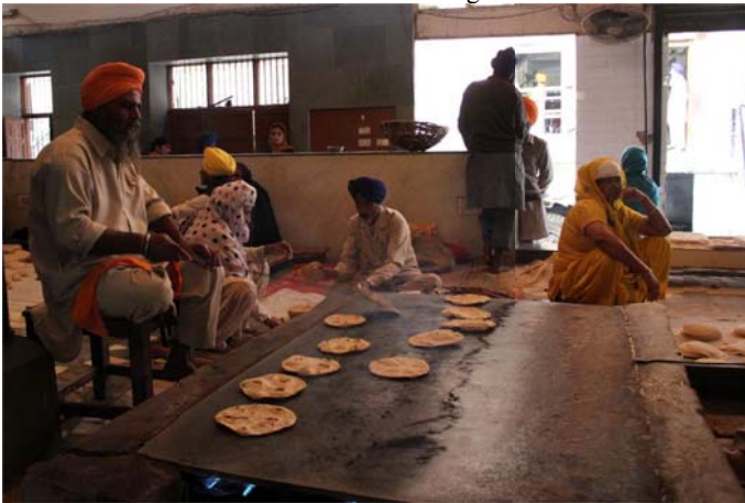
Around 200,000 Rotis are prepared every day at the langar which is served to the people.