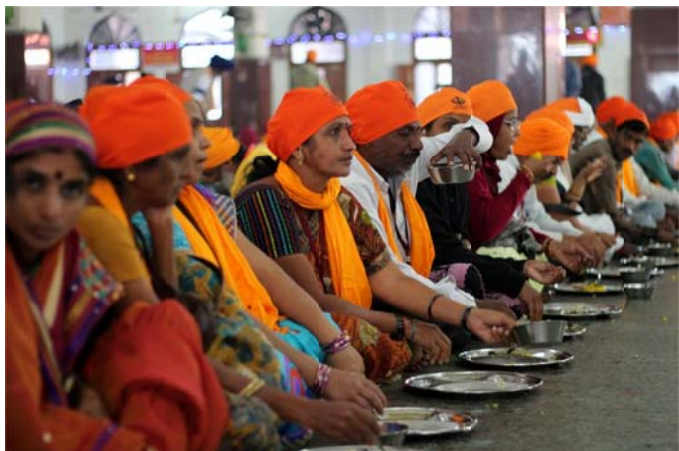
The lines of status, caste and class vanish at the langar. Everybody, rich or poor, is treated as equals