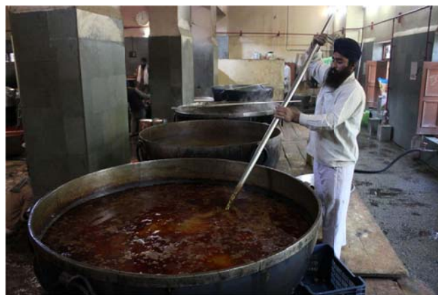
Some 450 staff and hundreds of volunteers help to run the kitchen.