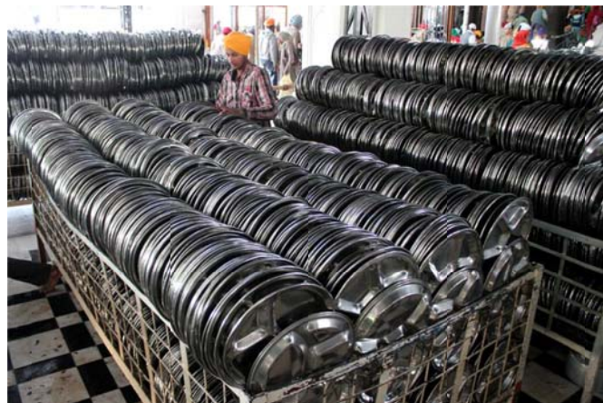
Running the kitchen also means washing and cleaning thousands of plates, bowls and spoons.