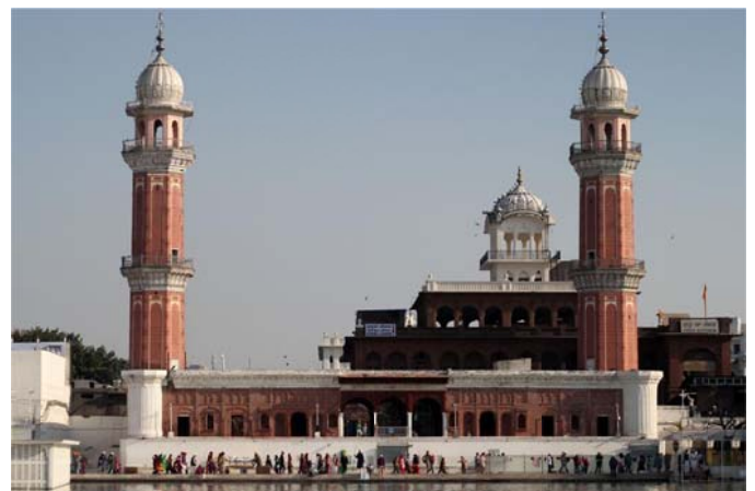
The "langar" or free kitchen at Golden Temple in the Indian city of Amritsar is perhaps the world's largest free eatery. The Langar or free kitchen was started by the first Sikh Guru, Guru Nanak

Women play an important role in the preparation of meals. Volunteers make stacks of Rotis that will be served at the free kitchen.