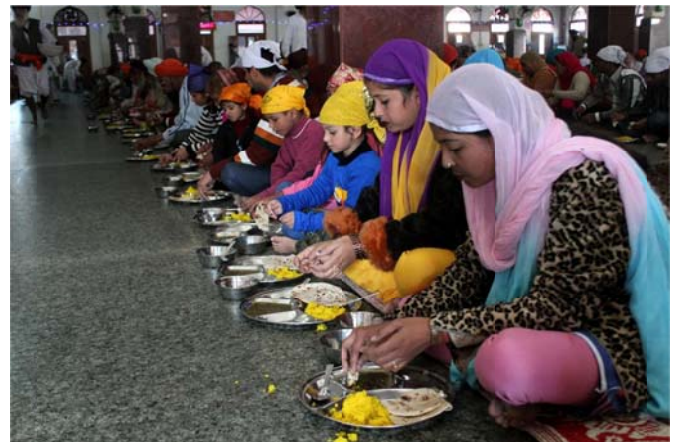
Langar teaches the etiquette of sitting and eating in a community situation.