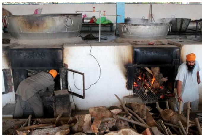
Five thousand kilograms of fire wood is used every day for preparing the meals at this langar that runs 24/7/365.