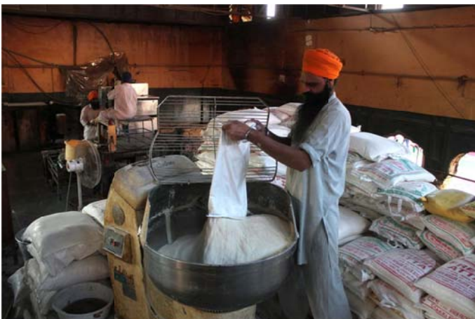
Wheat flour being put in a contraption that acts like a dough-maker. The dough will be used for making Rotis (Indian flat bread).