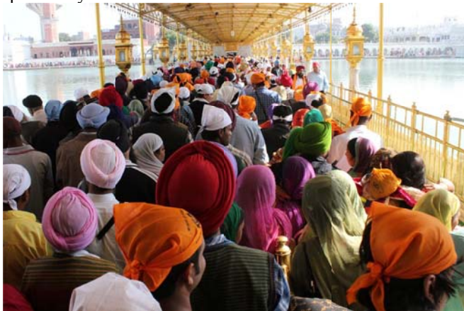
People from all over the world who have FAITH in Sikhism aspire to visit Golden temple at least once in their life time.