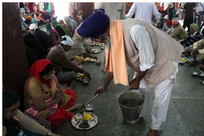
The meal served is hot but simple: comprising roti (flat Indian bread), lentil soup and sweat rice.