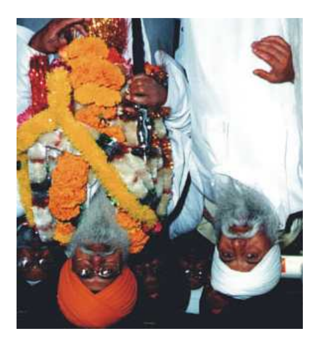
ਕਰਤੂਤਿ ਪਸੂ ਕੀ ਮਾਨਸ ਜਾਤਿ ॥ ਲੋਕ ਪਚਾਰਾ ਕਰੈ ਦਿਨੁ ਰਾਤਿ ॥ ਬਾਹਰਿ ਭੇਖ ਅੰਤਰਿ ਮਲ ਮਾਇਆ ॥ (੨੬੭)

kartoot pasoo kee maanas jaat, lok pachara kare din raat. Bahar bhekh antar mal maya.